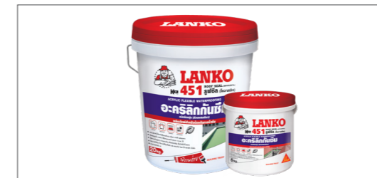
LANKO -451 วัสดุกันซึม ประเภทอะคริลิก