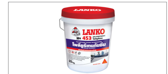
LANKO -453 วัสดุกันซึม ประเภทโพลียูรีเทน ดัดแปลง

ท่านสามารถสอบถามรายละเอียดเพิ่มเติมกับฝ่ายขายที่ท่านติดต่อ หรือสั่งซื้อมายังบริษัทฯ