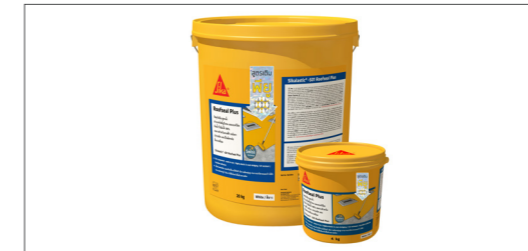
Sikalastic®-501 Roofseal Plus วัสดุกันซึม ประเภทโพลียูรีเทน ดัดแปลง