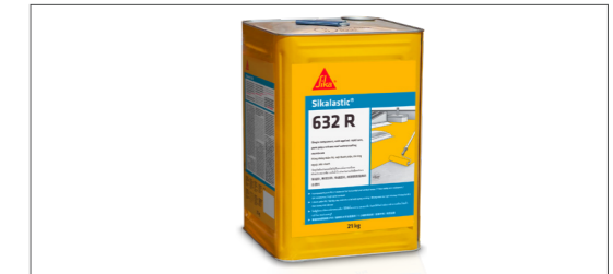
Sikalastic®-632 R วัสดุกันซึม ประเภทโพลียูรีเทน