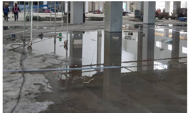
พื้นเป็นแอ่ง