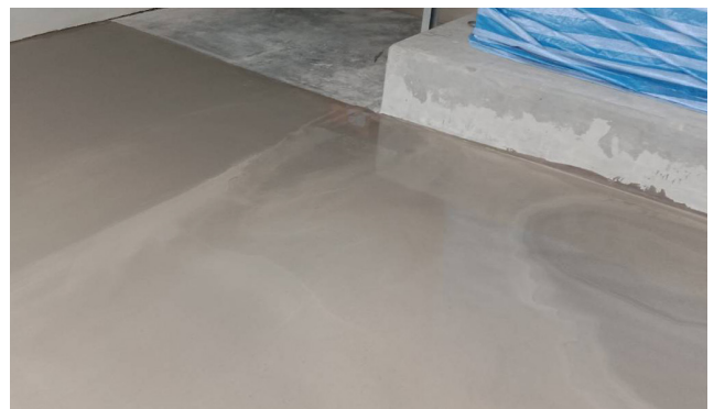
งานปรับระดับพื้น