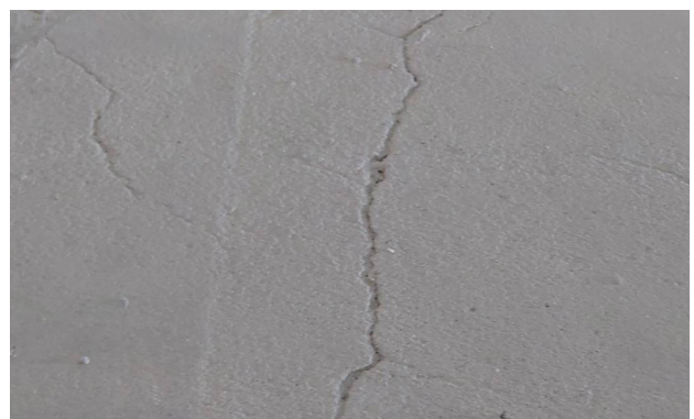
พื้นผิวแตกร้าวขนาดเล็ก