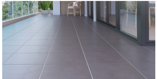
ปรับระดับก่อนการปูกระเบื้อง