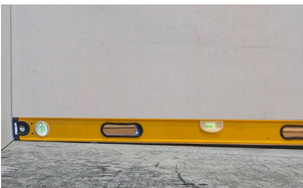
พื้นเอียงไม่ได้ระดับ