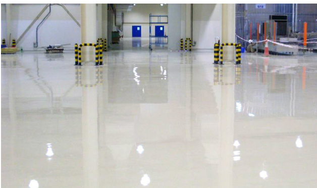
ปรับระดับก่อนงานพื้นอีพ็อกซี่