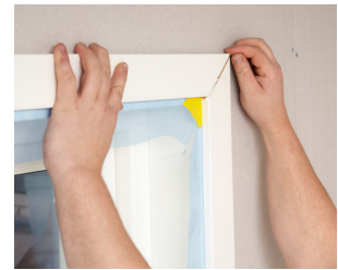
ติดไม้คิ้ว