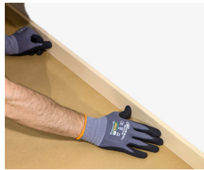
ติดบัวเชิงผนัง