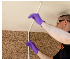
ติดรางเก็บสายไฟ