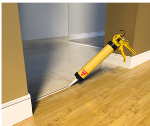
ใช้ยาแนวรอยต่อระหว่างพื้น

วัสดุยาแนวรอยต่อและติดยึด ประเภทโพลียูรีเทน ส่วนประกอบเดียว มีความยืดหยุ่น ยึดเกาะได้ดีกับพื้นผิวหลายประเภทใช้ได้ทั้งภายในและภายนอกอาคาร ใช้เป็นกาวสำหรับยึดติดวัสดุต่าง ๆ และใช้เป็นกาวยาแนวรอยต่อ ทั่วไป ทั้งแนวตั้งและแนวนอน สามารถยึดติดได้ดีกับ พื้นผิวคอนกรีต พื้นผิวก่ออิฐ หินเทียม กระเบื้อง เซรามิก ไม้ และ โลหะ