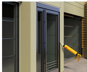
ใช้เป็นยาแนวกรอบประตูและหน้าต่าง