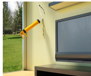
ใช้ซ่อมแซมรอยแตกหรืออุดช่องว่างบนผนัง